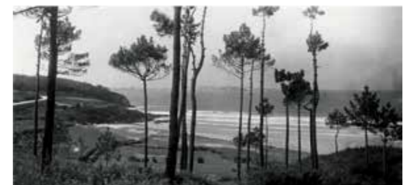
Bastiagueiro no 1937